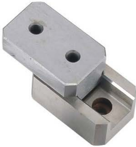
上模 upper mold